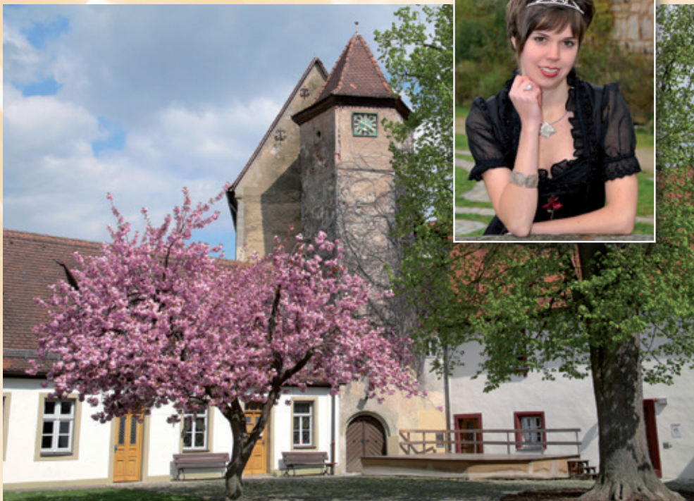
Karpfenmuseum im Schlosshof