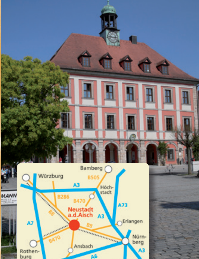
Rathaus in Neustadt a.d. Aisch